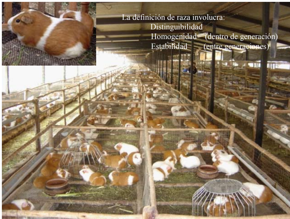
GRANJA DE PRODUCTORES DE LIMA Y ANCASH

2005 - 2006 En el primer trimestre se inicia la revalidación de líneas, para este proceso se recoge animales destetados de las granjas donde se validó la raza Perú. Debe apreciarse la persistencia de las características de raza de la progenie de los animales entregados para validación. En todos los casos la progenie machos ha alcanzado 1 kg a las 8 semanas de edad. Esto ratifica que los animales mantienen su capacidad productiva. En muchos casos la falta de crecimiento de la progenie Perú en las granjas es por efecto medio ambiente, considerándose que la calidad de la ración que reciben es la que determina que los animales exterioricen su capacidad de rápido crecimiento. Perú es una raza exigente en calidad de alimento. En julio 2005, se lanza raza Andina.