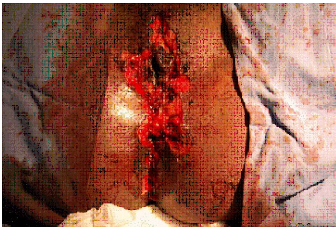
Foto 3. Aspecto de la región inmediatamente después de la exéresis quirúrgica radical de la lesión

papilomatosa vegetante con secreción fétida, de aspecto tumoral, que ocupa toda la vulva y se extiende a todo el periné (Foto 1).