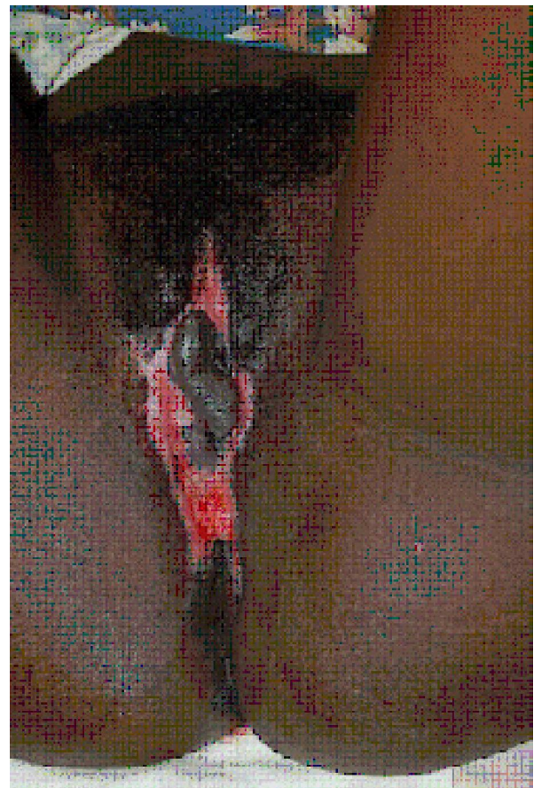
Foto 4. Evaluación postoperatoria realizada a las cuatro semanas del proceder quirúrgico

Se hizo remoción quirúrgica total de la lesión con excelentes resultados funcionales y cosméticos. No hubo complicaciones en el postoperatorio mediato (Foto 3), ni en el inmediato, según las valoraciones a las cuatro