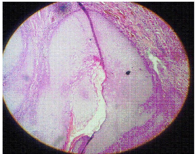
Foto 2. Microfotografía del estudio histopatológico donde se observa hiperqueratosis, acantosis y vacuolización citoplasmática