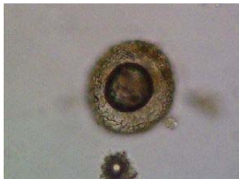
Figura 2. Huevo de Toxocara sp. Muestra de suelo del sector A del campus de la Escuela de Ciencias de la Salud, UDO-Bolívar, Ciudad Bolívar.

Sin diferencias estadísticamente significativas con relación al sector de procedencia ni en el caso de las muestras de suelo ( \chi^2 = 0,87 g.l.=3 p > 0,05 ) ni de heces ( \chi^2 = 3,75 g.l.=3 p > 0,05 ) (Tabla 2).