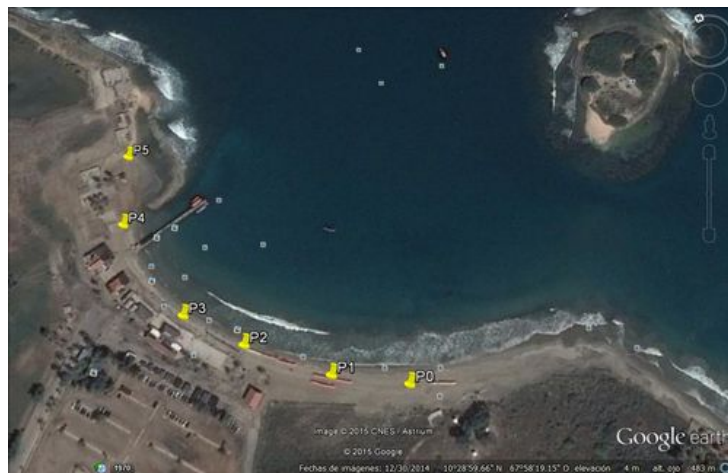
Figura 1. Puntos geográficos de muestreo. Playa Quizandal. Municipio Puerto Cabello, Venezuela (marzo 2013-enero 2014). Leyenda: puntos amarillos señalan la ubicación de puntos de muestreos.

Muestreo: Se llevó a cabo un muestreo sistemático, considerando la franja de la playa con mayor transitabilidad por los bañistas. Se trazó una transepta de 6 puntos geográficos, empleando Google Earth® enumerados desde Punto 0 (P0) hasta Punto 5 (P5), establecidos a cada 65 metros, hasta abarcar toda la extensión de la playa (Figura 1 y Tabla 1).