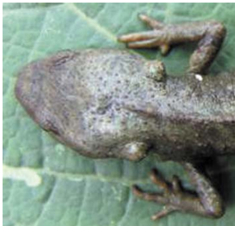
图 2 龙里瘰螈头部后端两侧突起

a: 背面观 (Dorsal view); b: 腹面观 (Ventral view)