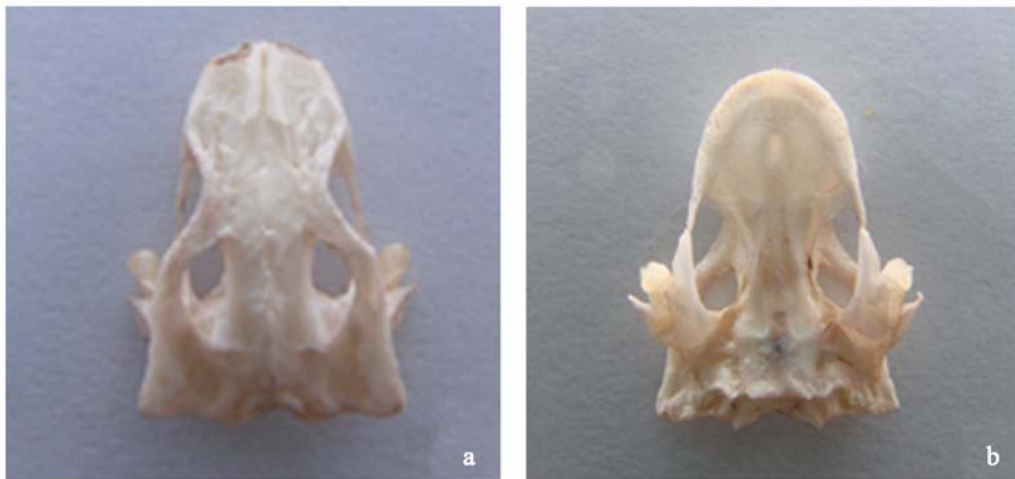
图3. 龙里瘰螈的头骨

卵 龙里瘰螈繁殖期为4月中旬—6月中旬,卵单生(图5)。解剖0705003号雌性标本,其输卵管中有16枚,呈圆形的成熟卵,动物极棕黑色,植物极灰白色,卵粒外有卵胶膜,呈椭圆形,生活时卵胶膜透明,卵径4.4×5.1mm。