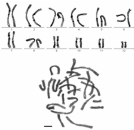
图 6 龙里瘰螈中期分裂相及核型 Fig. 6 Photomicrographs of chromosome at metaphase and karyotypes of Paramesotriton longliensis