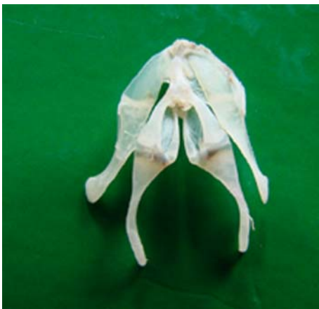
图4 龙里瘰螈的舌骨

a: 背面观 Dorsal view.; b: 腹面观 Ventral view.