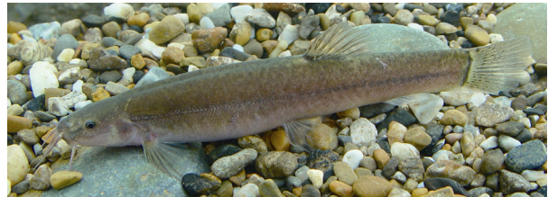
图 5 平头岭鳅活体照 Fig. 5 Living status of Oreonectes platycephalus

致谢: 感谢中国科学院昆明动物研究所陈小勇副研究员和审稿人对本文提出宝贵的修改意见。感谢广西都安畜牧水产局蓝家湖先生赠送本研究的标本和提供罗城岭鳅与平头岭鳅的活体照。