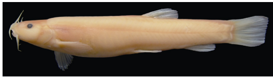
图1 罗城岭鳅副(模标本 KIZ2010003076, 75.0 mm) Fig. 1 Oreonectes luochengensis sp. nov. (Paratype KIZ2010003076, 75.0 mm)