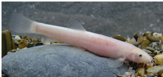
图2 罗城岭鳅活体照