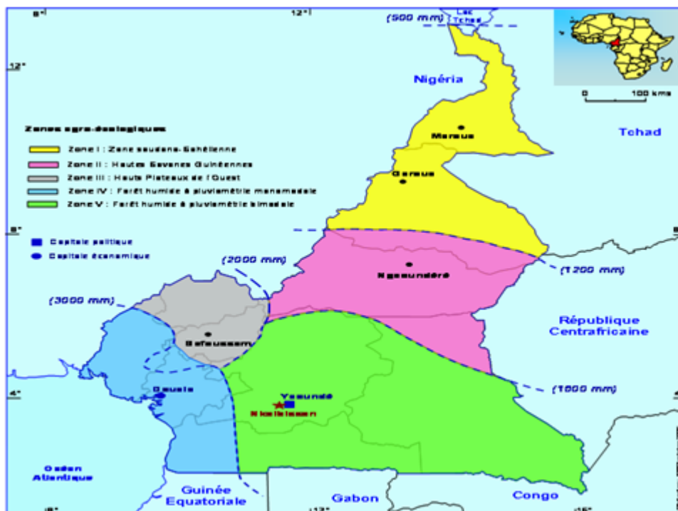
Figure 1. Les principales villes et les 5 zones agro-écologiques du Cameroun (IRAD, 2005).

Relation entre de B. bassiana et le scolyte. Beauveria bassiana envahit le scolyte au moment du forage du trou d'entrée dans la baie, alors que le scolyte se trouve la tête enfoncée dans le fruit du caféier et l'abdomen à l'extérieur. Le champignon adhère à son hôte et germe en émettant des filaments mycéliens. L'examen au microscope d'individus morts a montré la présence du mycélium dans les différents tissus de l'insecte, au niveau du tube digestif, des pattes, des élytres et des antennes. Après l'infection, le scolyte peut encore vivre au maximum pendant trois à six jours. L'insecte mort est recouvert d'une moisissure blanche caractéristique et reste fixé à l'orifice de la galerie (Mbondji, 1988).