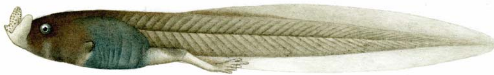
图 2 桑植角蟾 Megophrys sangzhiensis 的蝌蚪，侧面观

SVL: Snout-vent length; HL: Head length from tip of snout to the commissure of the jaws; HW: Head width at the commissure of the jaws; SL: Snout length from tip of snout to the anterior corner of the eye; INS: Internarial space; IOS: interorbital space, i.e., the smallest space between the inner edge of upper-eyelid; UEW: Width of upper eyelid; ED: diameter of eye; TD: Horizontal diameter of tympanum; LAHL: Length of lower arm and hand; LAD: Diameter of lower arm; HAL: Hand length; HLL: Hindlimb length; TL: Tibia length; TW: Width of tibia; FTL: Length of foot and tarsus; FL: Foot length.