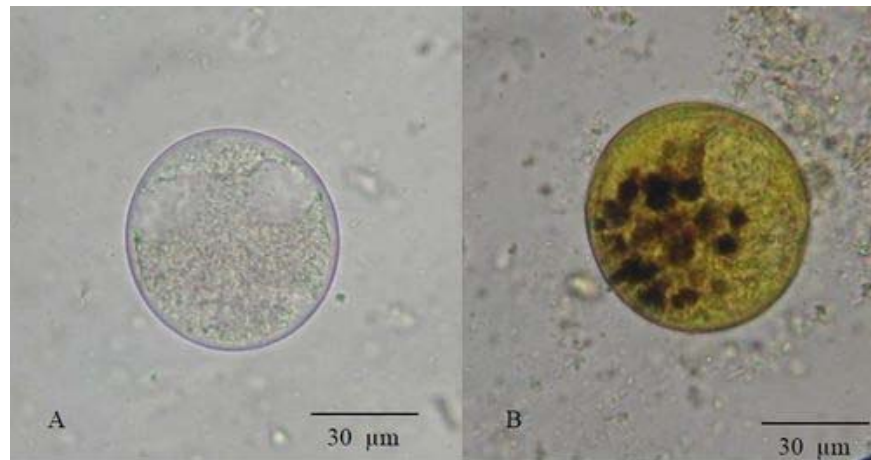
Figura 1.- Quistes de Balantidium spp. Examen microscópico directo a partir de heces de cerdo. A.- Examen en fresco con s.s 0,85%. 400x. B.- Coloración con lugol. 400x.